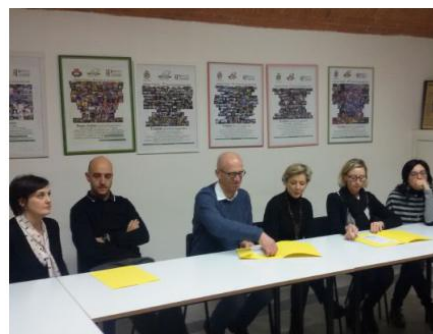
La conferenza stampa di ieri nella sede della Cisl dei Laghi

VARESE - (e.p.) Nel 2016 la Cisl dei laghi ha assistito 744 lavoratori, di cui 446 in vertenze individuali e 298 nelle procedure concorsuali. Rispetto all'anno precedente, si è registrato un calo del 14% nelle vertenze individuali e un incremento del 15% in quelle concorsuali. Nell'insieme, 304 casi hanno riguardato recupero crediti (68%), mentre 80 lavoratori sono stati seguiti dopo un licenziamento (17,9%). Resta un problema di liquidità delle aziende che faticano a retribuire la forza lavoro alla scadenza. Numerose poi le "liti" innescate da ex collaboratori familiari. In aumento le denunce di mobbing o per le condizioni di lavoro ritenute inaccettabili. E poi c'è il problema dei voucher, utilizzati soprattutto nel settore dei